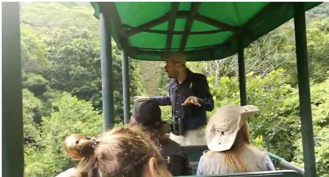
SEGUNDO ENCUENTRO AVITURISMO CON RAIN FOREST ADVENTURES JACÓ