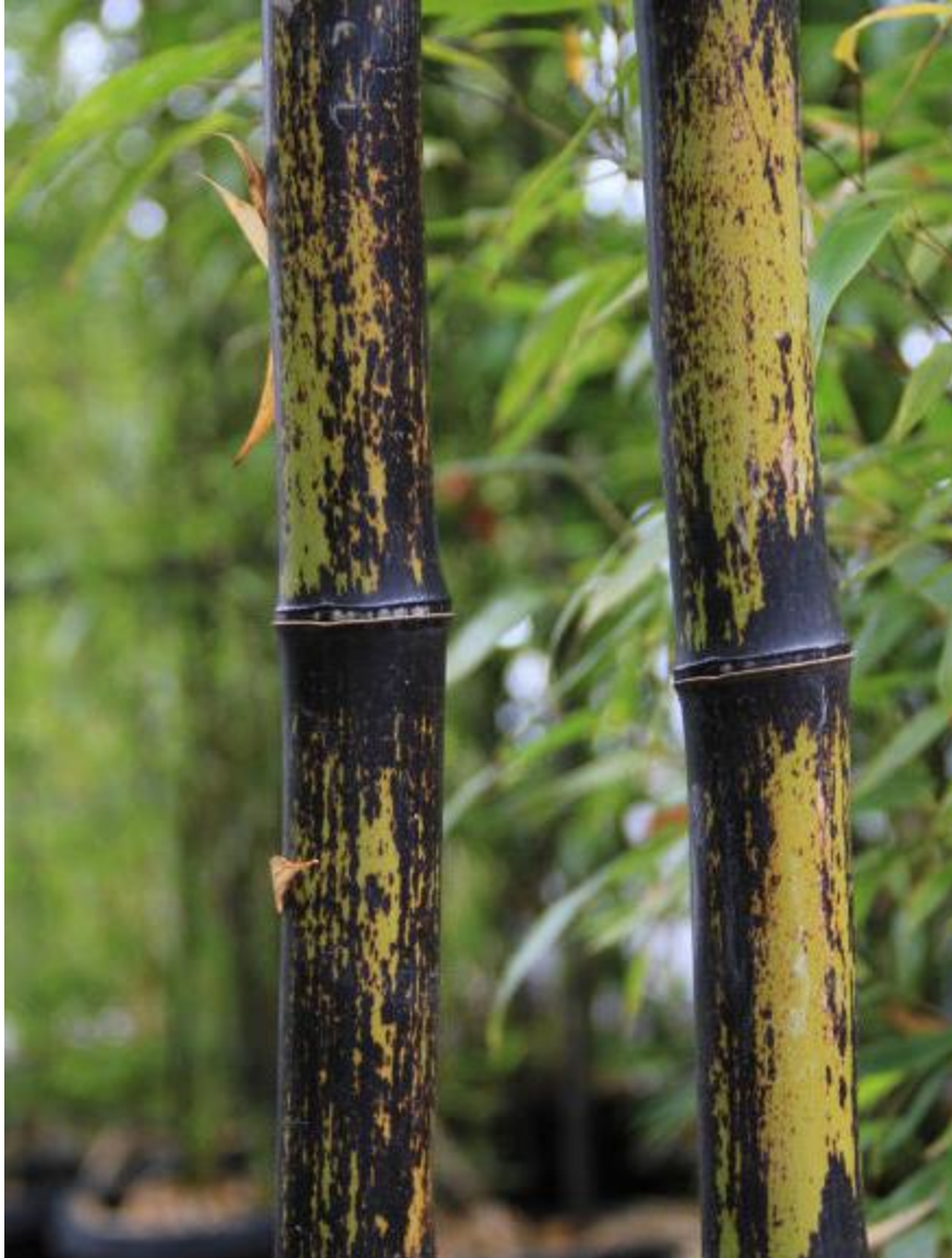
Escrito por: Gabriela Mateo